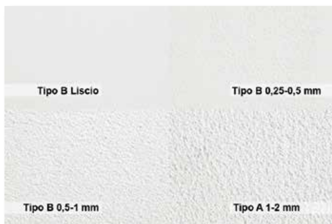
Granulometria delle varie finiture