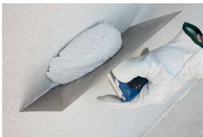
Applicazione con Spatola americana

Il prodotto viene infine ricoperto con la pittura Thermofotocatalitica AfonCasa. Per le specifiche di applicazione si rimanda alla scheda tecnica e lavorativa del prodotto.