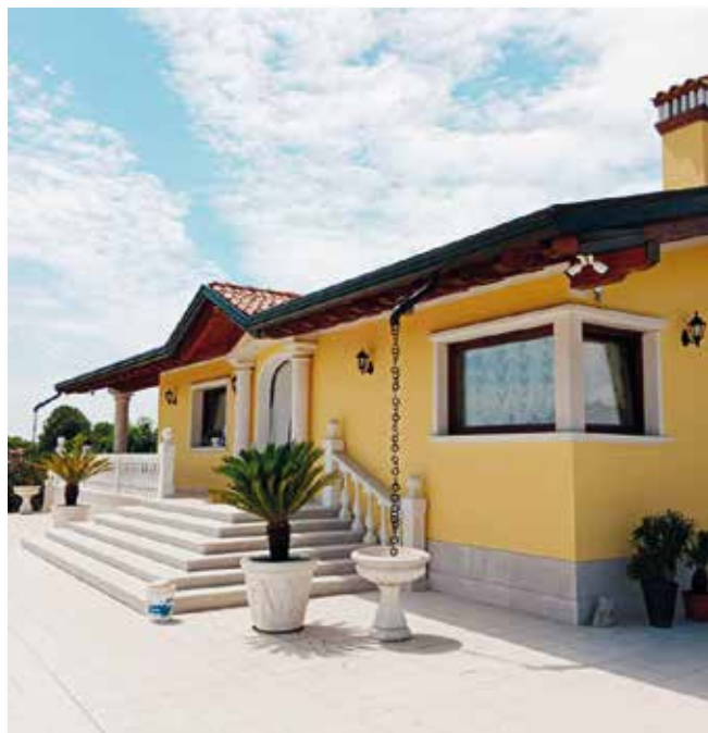
PORDENONE: Facciata trattata con Afontermo®