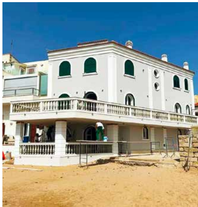
LA CASA DI MONTALBANO (RG): Facciata trattata con Afontermo®