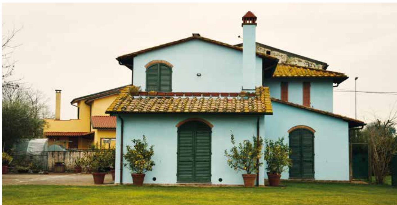
PISA: Facciata trattata con Afontermo®