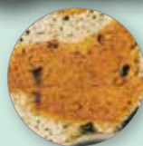
Inerti coibenti di sughero

Settore applicativo: sotto pavimenti, fra un piano e l'altro a piano terra per eliminare umidità e condensa, sotto tegola per formare solette termoisolanti e impermeabilizzanti e per isolare termicamente terrazze.