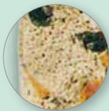
Massa alveolare assorbente onde sonore